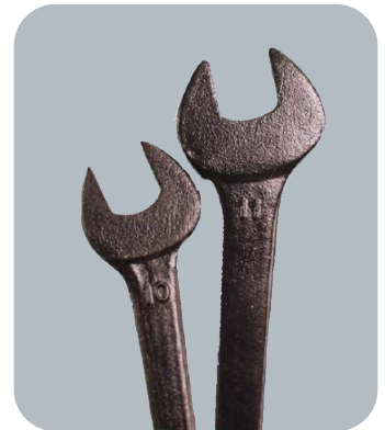
Clés de serrage pour mandrins R231-232-233-234 Code art. 460 000 423